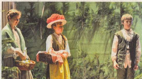
Die Kinder der 5. Klasse der Helmut von Kugelgen-Schule überzeugten mit ihrer Darbietung von „Das kalte Herz“

Der inhaltsreiche Stoff wird sich den Kindern mit zunehmenden Alter immer mehr erschließen. In den Schlussworten des Sprechchors aller konnten sich Jung und Alt wiederfinden: „Denn was du durch eignen Willen und